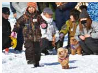
▲愛犬と来場した方を対象としたアトラクション「ワンワンダッシュ」

◆冬の稚内を代表するイベント 映画「南極物語」に出演したタロとジロ役の犬が、稚内市に寄贈されたことを記念して開催されるようになった犬ぞり大会。第1回大会が、昭和59年3月に開催されて以降、毎年2月末頃に開催されるようになり、今年で32回目となります。毎年、全国から多くの参加があり「犬たちの甲子園」とも呼ばれ、国内有数の規模を誇ります。8競技13種目とレース種目も多く、中でもスピード感あふれる「6頭引レース」は、人犬一体となった姿が観客を魅了します。また、「愛犬仮装&ファッションショー」や、「犬ぞりチャレンジ(観客犬ぞり体験)」などもあり、参加者だけでなく観客も楽しめる