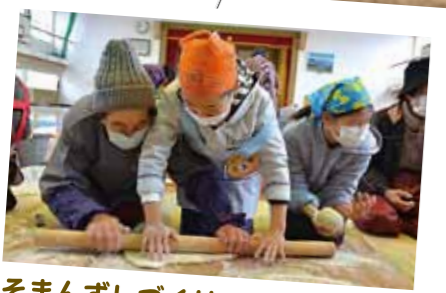
そまんずづくりで高齢者と交流 ■別府校区で高齢者と子どもたちとのふれあい交流「そまんず作り」が12月20日、別府地区公民館などで行われ、約160人が参加しました。