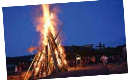
田布川集落で鬼火たき ■1月18日、田の神様近くの田んぼで行われました。火の神乙女太鼓の演奏に合わせて、今年の年男・年女の子どもたちがやぐらに向けて火矢を放ち、火がつけられました。