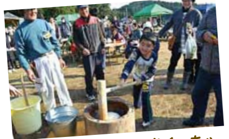
第6回自然花まつりinきぐつちや ■12月23日に木口屋集落で開催されました。参加者は餅つきやミニ門松作り、そば打ち、さつま揚げ作りなどの体験を通し、親子の絆を深めていました