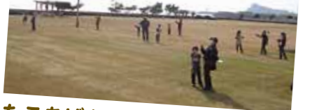
たこあげを楽しむ ■1月4日、児童館正月行事のたこあげが台場公園で行われ、親子や地域の高齢者33人が参加しました。子どもたちは、手作りのたこを高齢者たちに教わりながら空高くあげていました。