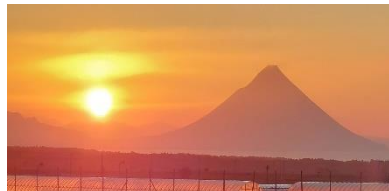
【別府中から望む開聞岳と朝日】

地震直後の開催となった正月恒例の東京箱根間往復大学駅伝競争、通称[箱根駅伝]でも、優勝した青山学院大学の原晋監督が、無事開催できたことに感謝の言葉を述べていたのも大変印象的でした。