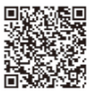
▲電子書籍版はこちらから