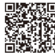
▲デジタル庁政策ページ

転出届はマイナポータルを通じたオンラインでの提出も可能です。 このサービスを利用する方は転出に当たり市役所への来庁が原則不要となります。マイナンバーカードをお持ちの方で国内での引越しをする方が利用できます。 ※マイナポータルを通じた転出届の提出をした後は、別途、転入先の市区町村の窓口で転入届等の手続きが必要です。 詳しくはデジタル庁政策ページをご覧ください。