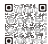
▲環境ラベルの情報を見る