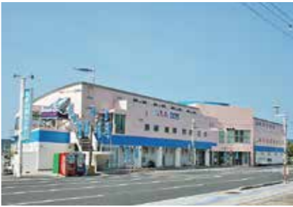
▲リニューアル前のお魚センター

聞かれるなど、多様化するニーズへの対応や施設の魅力度向上は大きな課題となっていました。このような中、お魚センターでは、「観光拠点」「海産物推進」「市民活躍」の3つのコンセプトに基づき再生に取り組んでいくこととし、本年度、国の交付金を活用して実施した太陽と鯉のまち「枕崎」ウォーターフロント拠点整備事業で大規模改修を行い、新たな魅力の詰まった施設へとリニューアルを遂げます。