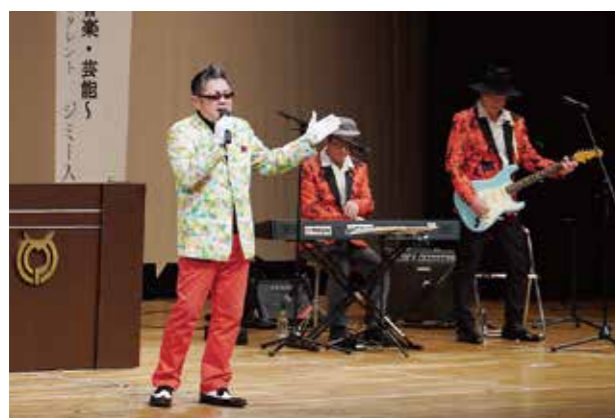
表彰者の紹介(敬称略)