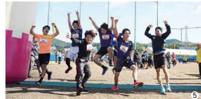
①こどんRUNを楽しむ参加者 ②鹿児島大学大学院陸上部による陸上教室 ③まくらざきハーモニーネットワーク委員会による茶節の振る舞い ④元気よくスタートするかつおジョギングの参加者 ⑤リレーマラソンで優勝した「フィジコ〜RUN倶楽部」喜びのゴール