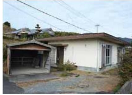
▲①田布川町703番の建物