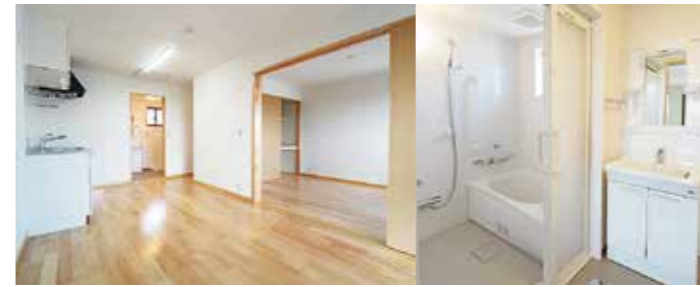
▲内装が完成した谷原団地の室内 ▲洗面所とバスルーム

現在建設中の谷原団地は、住宅に困窮し、定められた所得額以下の方に生活していただくため、国の補助金と市の負担で建設される公共賃貸住宅です。申込みには、法律等によりさまざまな資格や条件がありますので、下記の事項等を確認の上、申し込んでください。