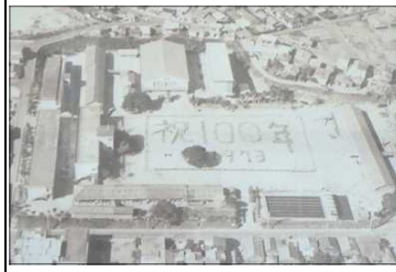
しょうわ ねん 昭和48年 じどうすう せい 児童数1689名 がつきゆうすう がつきゆう 学級数42学級