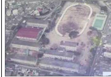
しょうわ ねん 昭和62年 じどうすう せい 児童数1231名