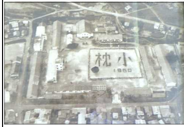
しょうわ ねん 昭和35年 じどう せい 児童数2524名 がつきゆう がつきゆう 学級数50学級

枕崎小は、創立150周年を迎え ますが、校長室にはいくつかの航空写真 が保存されています。今月から来月にか けて紹介していきます。