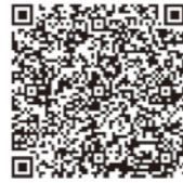
▲申込みはこちらから

です。ので、問合せか左記の二次元バーコードからお申し込みください。 ■必要なもの スマートフォン ■主催・問合せ・申込み 株式会社フォーエバー 枕崎事務所(GMフォーエバー) TEL 78-3333