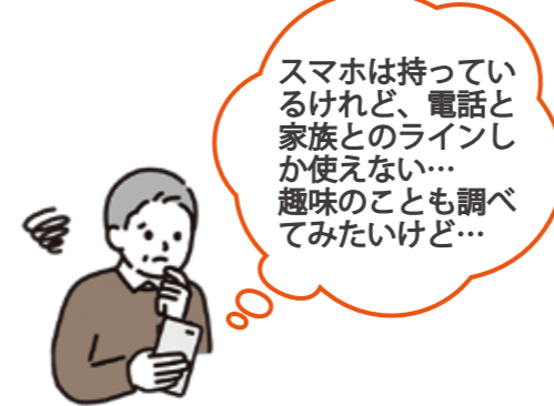
スマホやタブレットの利用状況(年齢別)

例えば、スマホを使って、早く正確に情報を得ることができれば、災害で避難するときなどの冷静な行動にもつながります。また、オンライン申請等で窓口に行かなくても手続きができるものもあり、感染症予防にもつながります。すべてをデジタルに置き換える必要はありませんが、「デジタル「も」活用して、便利な生活を目指してみたいか?」という問いに、意外と簡単に、便利だと実感できるはずですよ。