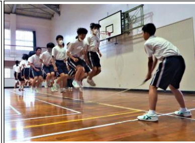
【3年 仲間とチャレンジ】

「仲間とチャレンジ!」では、学級一丸となって、「1・2・3・・・」とかけ声を出して心をつなげて取り組んでいました。跳ぶ生徒が息を合わせて跳ぶことはもちろんですが、縄の回し手も体全身を使い、跳びやすいように大きく回すことが必要です。上級生になればなるほど縄を回す速さが速くなるころにも、成長の証が感じられました。