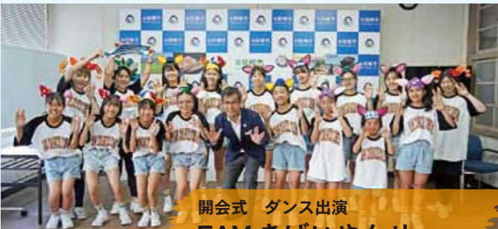
開会式 ダンス出演 FAM きばいやんせの皆さん