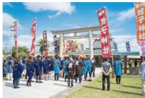
▲きばらん海神事の様子

皆さん、こんにちは! 枕崎で2回目の夏がきました。まだまだ暑い日が続きますので、熱中症対策をしっかりと、暑い夏と一緒に楽しみながら乗り越えましょう!