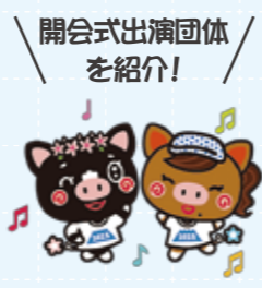
開会式出演団体を を紹介!

本市が主催となって8月11日(金)から10月31日(火)まで、果ての鉄道展が南浜館にて開催されています。テーマは「南の果てから過去と未来へ、新しい鉄道の旅へ」ということで、ノスタルジックな写真や模型・未来を見据えたテクノロジーまで展示されています。会期中は休館することはなく、開館時間は午前9時から午後5時(最終入場は午後4時30分)までとなっています。観覧料は一般800円、高校・大学600円、中学生以下無料です。南の果てから世界の果ての鉄道を見られる機会となっております。皆さんぜひ足を運んでみてはいかがでしょうか!