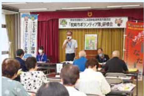
■問合せ スポーツ・文化振興課(総合体育館内) TEL76-6151

8月18日(金)に市民会館で、かごしま国体に向けたボランティア研修会を開催しました。36名の方が集まり、なぎなた競技会における仕事内容の確認や、ボランティアスタッフとしての心がまえ、おもてなしの心を学びました。 なぎなた競技会の当日は、80名ほどのボランティアの方々に活躍してもらおう予定です。