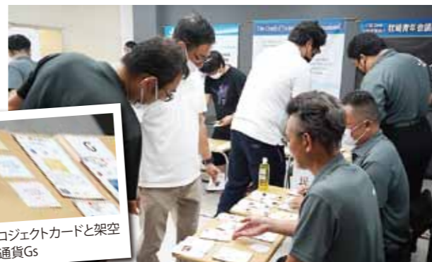
プロジェクトカードと架空の通貨Gs

7月8日に開催したお披露目および出発式では、絵画を描いた児童・生徒、文字や写真を提供いただいた方やその関係者等が集まり、完成を祝いました。トラックは今後、関西方面を走行し、本市のPRが期待されます。