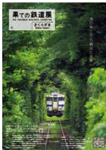
※この絵は検討中のイメージであり、実際とは一部異なります。

その「ふるさと枕崎会」も新型コロナウイルス感染症の影響を受けて活動の自粛を余儀なくされ、総会を開催できない期間が続いていました。そしてようやく、そのふるさと枕崎会が昨年11月開催の「近畿枕崎会」を皮切りに復活してきました。今年の7月には「東海枕崎会」が開催されました。10月には「関東枕崎会」が計画されています。久しぶりの「ふるさと枕崎会」は、それはそれは盛り上がりです。懐かしい皆さんとの再会が2年ぶり、3年ぶり、さらに懐かしさが増して、会場では皆さんの笑顔が弾けまします。私も10月の関東枕崎会への参加をとっても楽しみにしています。各ふるさと枕崎会には、実は悩みもあります。新入会員が少なく、会員の高齢化が進んでいることです。しかしながら、先の東海枕崎会には20代の若者も参加してくれて頼もしい印象を受けました。