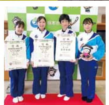
昨年行われた栃木国体では 演技競技で見事日本一!