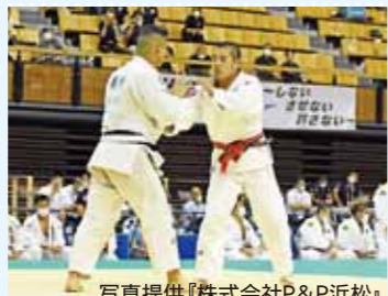
▲令和4年度全国高等学校総合体育大会