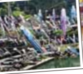
◀3,500匹の鯉のぼりとかつおのぼり

4月23日、熊本県の杖立温泉で行われた「杖立温泉鯉のぼり祭り」において、さつま鯉節協会および本市かつお鮮魚販路対策協会によるPRイベントを開催しました。