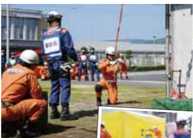
▶煙体験ハウスで避難体験