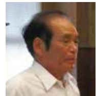
議員 通占 男 補