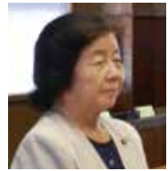
豊留 榮子 議員