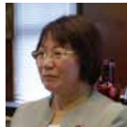
眞茅 弘美 議員