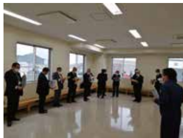
枕崎漁港高度衛生管理型荷捌き所