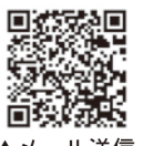
▲メール送信フォーム

このような環境があるのはドラマだけだと思ひました。地元大阪での生活も好きですが、人の温かきを感じる事ができる枕崎市での生活も好きです。全国的に鯉節が有名ですが、私は腹皮も大好きです!この大好きな枕崎市に新しい風を吹かせられるよう2年目、頑張っていきますので、今後ともよろしくお願ひいたします!