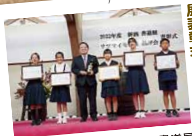
2022「新酒」書道展表彰式

■10月29日に妙見神社で行われ、東鹿籠太鼓踊りが奉納されました。3年ぶりとなる奉納に多くの観客でにぎわっていました。