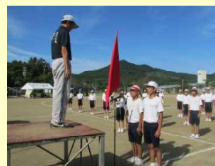
赤白団長の選手宣誓

当日は、天候に恵まれ、予定通りに競技を行うことができました。学年種目、短距離走、800、1500m走、リレー、応援合戦と、それぞれの種目でこれまでの成果を存分に発揮していました。部活動紹介では、全学年の部員が行進し、体育後援会長から激励の言葉をいただきました。応援合戦では赤白とも制限時間6分をいっぱい使った演舞を披露し、審査員を大いに悩ませました。