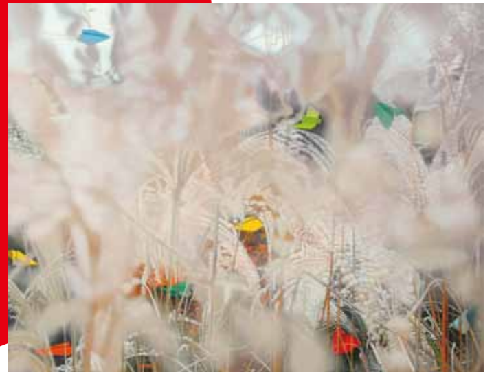
第2回 枕崎国際芸術賞展 大賞作品 全民玉(東京都) 「雲隠れ1」

〈枕崎市ホームページ〉 http://www.city.makurazaki.lg.jp/