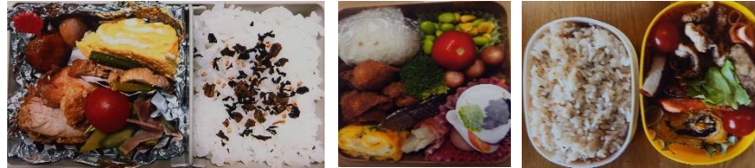
【1年】 【2年】 【3年】

ご家庭でも「県民の日」を機会に「鹿児島のよさ」について親子で語り合ったでしょうか。