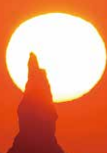
立神岩之夕陽西下美景

枕崎市的地標「立神岩」。與夕陽交疊的季節時又名為蠟燭岩，美麗景致與神祕氛圍吸引國內外眾多觀光客到訪。