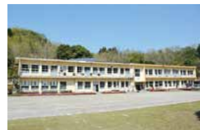
地域課題解決のためのICT拠点整備事業【令和3年度繰越事業】

4,597万円 金山小学校の跡地を活用し、雇用の創出や地域活性化など、デジタル技術を活用した地域課題解決のための推進拠点として整備します。