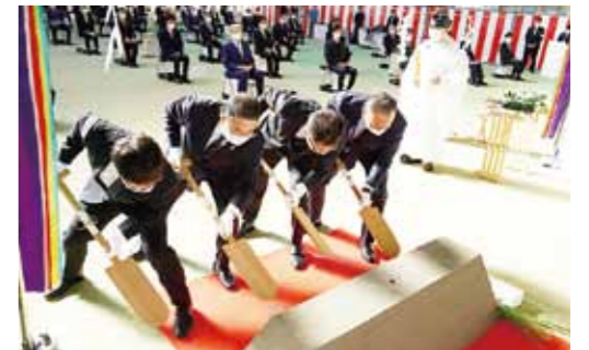
▲安全祈願祭の様子(令和4年2月11日)

令和6年9月からの本格稼働に向けて、令和4年3月から本格的に同クリーンセンターの工事が始まりますが、今後も安全安心を最優先して、地域の環境保全に努めていきます。