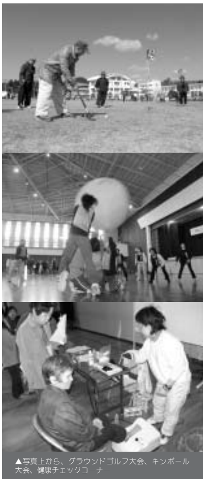
▲写真上から、グラウンドゴルフ大会、キンボール大会、健康チェックコーナー