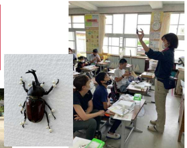
「昆虫採集」分科会の活動の様子