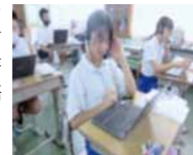
▲別府小学校の様子

タブレットとヘッドセットを使って、流れてくる英語の音声を聞き、質問をしたり質問に答えたりしながら、学習した英語表現がどの程度身に付いているのかを確認していました。