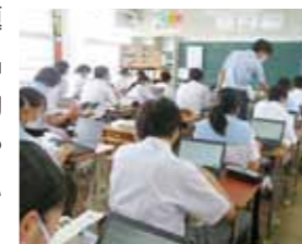
▲枕崎中学校の様子

AI搭載のドリル教材で問題演習をすると正解率が瞬時に変わるので、生徒は理解の状況を的確に把握でき、自ら反復練習や難しい問題に進んで挑戦していました。