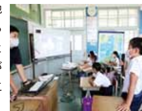
▲桜山小学校の様子

暖かい地域(枕崎市)と寒い地域(稚内市)の気候と人々の暮らしについて、互いに調べたことをオンラインで発表し合いながら遠く離れた地のよさを身近に感じる機会となりました。