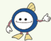
下水道マスコットキャラクター 「スイスイ」