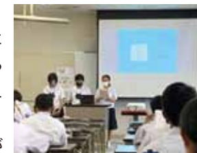
▲立神中学校の様子

「郷土に関する学習」では、フィールドワークで学んだことや郷土資料で調べたこと、さらにインターネットで検索したことなどをスライドにまとめ、ICT機器を効果的に活用しながら発表していました。