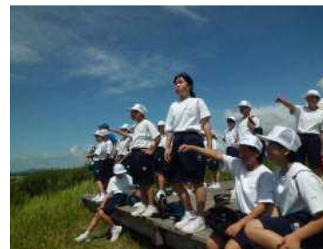
【吹上浜を眺める1年生】

・6月は行事が多く、練習に身が入らないときもありましたが、本番当日は、皆吹っ切れた清々しい表情をしていました。地区総体や期末テストといった大きな行事が終わり、ほっとした様子で一生懸命に歌っていました。私も指揮を振ることが、どんどん楽しくなりました。 [3年]