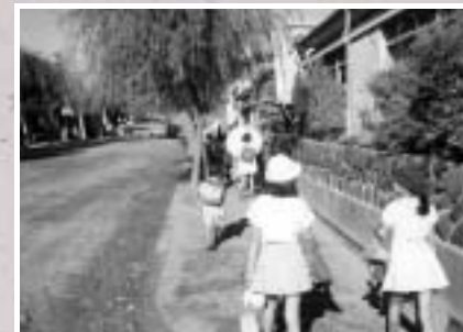
市役所通り（昭和30年ごろ）