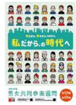
▲男女共同参画週間ポスター

4分野で男女格差を数値化し順位付けしたもので、156カ国中、日本は120位でした。前年の121位とほぼ変わらず、政治や経済分野における女性の進出が進んでいない状況です。性別に左右されず、『自分らしさ』を持った人たちが自由な発想で、あらゆる可能性に向かって「これから」を創っていきける社会のために、この週間に機会に、私たちのまわりの男女共同参画について、考えてみませんか？