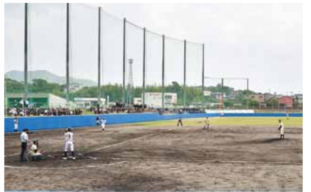
生徒会主催による交流試合を開催 ～枕崎高校野球部と鹿児島水産高校野球部が交流試合～

4月30日、新たに整備された市営野球場において、枕崎高校野球部と鹿児島水産高校野球部による交流試合が行われました。今回の交流試合は、両校の生徒会が主体となって初めて開催し、試合開始前にはお互いの健闘を祈り、手作りの横断幕を交換し、交流を深めました。また、市に対しても両校で協力して作成した横断幕が寄贈されました。試合は、枕崎高校が10対0(6回コールド)で鹿児島水産高校に勝利しました。