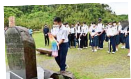
平和学習で折り鶴を献納 ■5月19日、立神中学校の2年生が平和学習の一環で火之神公園の平和祈念展望台を訪れ、手作りの折り鶴を献納しました。