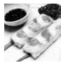
かつおづけの巻き巻き

日時 10月22日（日）午前10時から正午 場所 枕崎お魚センター1階 問合せ 枕崎かつお鮮魚販路対策協会 TEL731092（水産商工課）