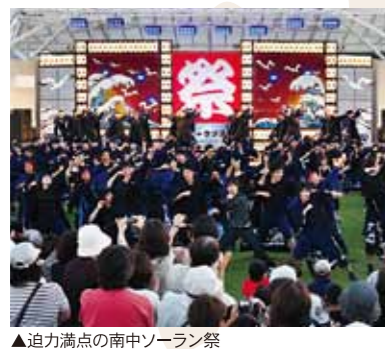
▲迫り満点の南中ソーラン祭

◆ 全国の熱い踊りが堪能できます! 食マルシェと同時に開催で、稚内市子ども芸能祭・南中ソーラン祭が行われます。稚内の幼稚園から中学校まで全ての学校が参加し、踊りの基本は同じでも、随所にオリジナリティを加えた踊りを披露していきます。