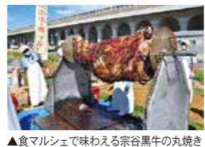
▲食マルシェで味わえる宗谷黒牛の丸焼き

◆ 食マルシェで味わえる宗谷黒牛の丸焼き の協賛イベントも同時開催されています。一度にたくさん楽しめたいこと間違いなしです! ◆ 全国に名をとどろかせる南中ソーランの熱い踊りが堪能できます! 食マルシェと同時に開催で、稚内市子ども芸能祭・南中ソーラン祭が行われます。稚内の幼稚園から中学校まで全ての学校が参加し、踊りの基本は同じでも、随所にオリジナリティを加えた踊りを披露していきます。