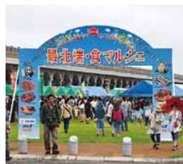
▲多くの人で賑わう「最北端・食マルシェ」

◆ 最北のグルメが満喫できます! 8月23日・24日、最北端・食マルシェ2014が開催されます。このイベントは、主に最北端ならではの味覚が楽しめることあって、多くの人で賑わいをみせます。また、北の食材を使ったステージゲームや、クイズ大会、稚内ブランド抽選会など、楽しい催しが行われているほか、多く