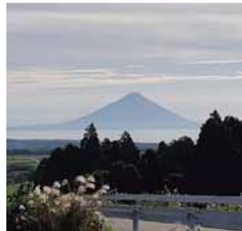
写真は提供していただいたものを掲載しています。