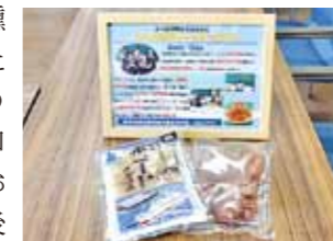
▲かつおポニートチップス

かつおポニートチップスは、鹿児島水産高校の課題研究の授業で開発されたチップスです。新鮮なかつおを調味料に漬けて味付けし、燻製にした後に薄切りにしたもので、ジャーキーのように噛めば噛むほど旨味が口の中に広がります。かつおポニートチップスは、今後商品化される予定です。