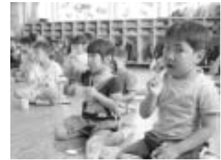
若いころから正しい磨き方を

「磨いている」から「磨けている」へ 歯みがきの最大の目的は、むし歯や歯周病の直接原因となる歯垢(プラーク)をとり除くことです。食べかすをとるためではありません。歯垢は無色透明で、一度歯につくとなかなかとれません。きれいに見える歯でも歯垢が