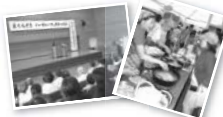
▲ハーモニフェスティバル