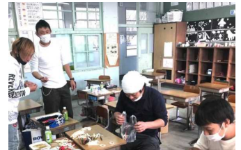
バザーの準備をする様子

11月22日にPTAバザーを開催します。コロナ第3波の報道も聞かれますが、中止ではありません。新生活様式の下「コロナに負けない」熱い思いでの開催です。いろいろなコロナ対策を行っていきますので、御理解・御協力をお願いします。