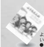
ようちえんのいちにち ●ふじた ひおこ(絵) おか しゅうぞう(作)