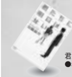
君たちに明日はない ●垣根 涼介(著)