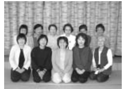
健康指導員の皆さん(写真は11名ですが全員で15名です)

これからも勉強を続け、皆さんの健康づくりに少しでもお役にたてたら…と思う毎日です。