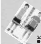
愛は天才じゃない ●生島 淳(著) 福原 千代(述)

※大勢の方々にいろいろな本を見ていただくための処置ですので、ご協力をお願いします。